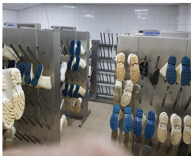
Inštalácia prístroja PT-1E OEM a PT-1E v sušičoch pracovnej