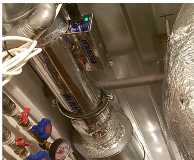
DEZOSTER TM-1E (PT-1E OEM) vo ventilácii pasívneho domu .