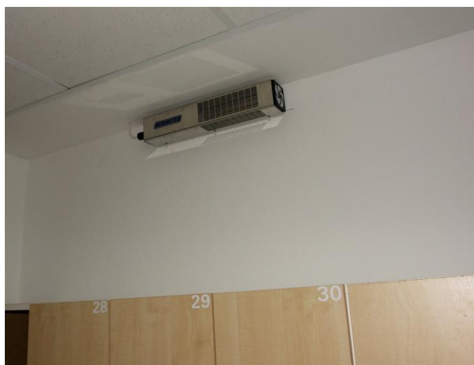
Inštalácia prístroja PT-1D Fan v šatni .