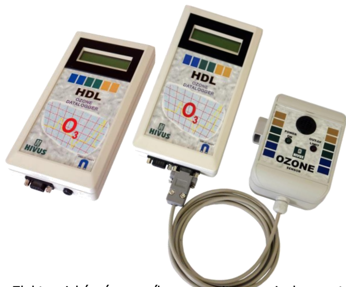
HDL O3 Datalogger (Hivus, s.r.o. Žilina)

Cenovo výhodný prístroj na monitorovanie koncentrácie ozónu.